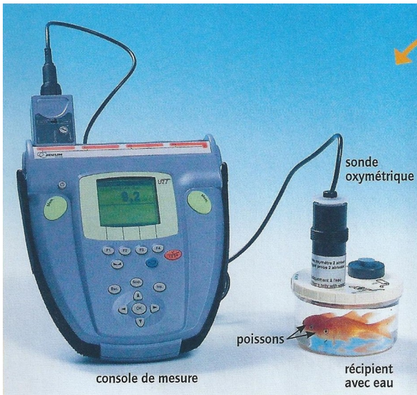
Doc. 1 : Le montage expérimental

Les animaux aquatiques respirent-ils aussi ?