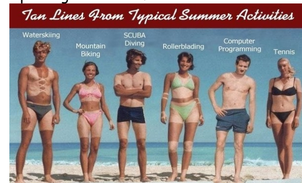
Doc. 4 : Le bronzage

Le bronzage correspond à un changement de pigmentation de la peau suite à une exposition prolongée au soleil.