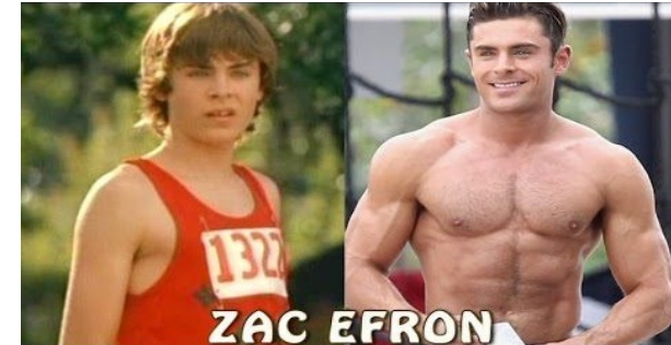
Doc. 3 : le développement musculaire.

Suite à un entraînement intensif, la masse musculaire d'un sportif peut considérablement augmenter. Mais, si le sportif cesse de pratiquer intensément, sa masse musculaire va diminuer.